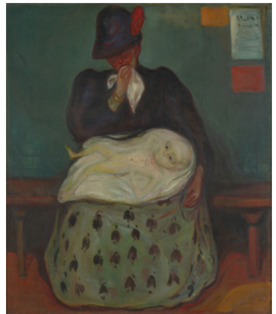
Edvard Munchs «Arv» (1897-99). En kvinne holder et syfilissykt barn i fanget. Arv ble tidlig satt i sammenheng med Ibsens drama Gengangere (1881) som også handler om syfilis.

Hun trekker frem den første engelske krimromanen, «Månestenen» av Wilkie Collins fra 1868, som et eksempel på en bok der arv setter i gang alt. Noen arver en diamant som er forbannet. Den er det mange som vil ha, og det setter i gang