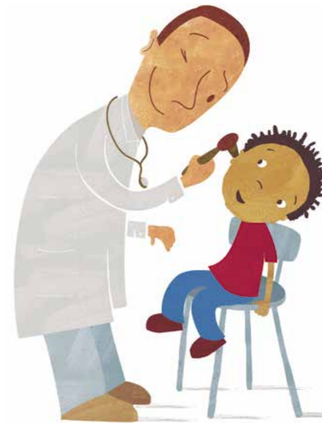
Hos legen med ørebetennelse

Barn som puster inn tobakksrøyk, må oftere til legen enn andre barn