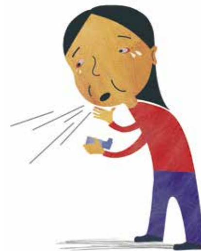
Barn med hoste, irriterte øyne og astma

Barn som puster inn tobakksrøyk, må oftere til legen enn andre barn