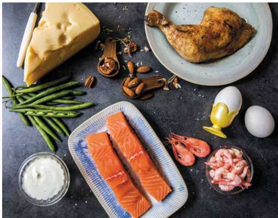
Eksempler på mat med høyt proteininnhold.

Eksempler på mat med høyt proteininnhold er egg, meieriprodukter, fisk, skalldyr, ost, fjærkre og kjøtt, nøtter og belgvekster.