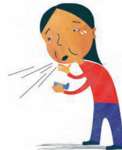
Dzieci z kaszlem, podrażnionymi oczami i astmą

Dzieci wdychające dym tytoniowy muszą odwiedzać lekarza częściej niż inne dzieci.