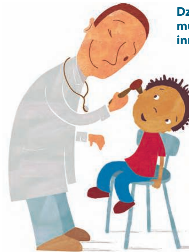
U lekarza z zapaleniem ucha

Dzieci wdychające dym tytoniowy muszą odwiedzać lekarza częściej niż inne dzieci.